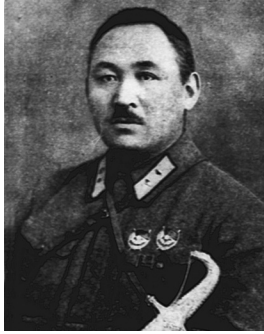
МУСА МОРТАЗИН 1891 – 1937

Муса Лут улы Мортазин – 1918 йылда Башкорт милли-азатлык хәрәктендә әүзем катнашкан башкорт офицерларҙың береһе, легендар комбриг, дәүләт эшмәкәре. Ул 1891 йылдың 20 февралендә Ырымбур губернаһы Вернеуральск өйәҙенең Күбәләк-Тиләү улысына ҡараған Көсөк ауылында (хәҙерге Башкортостан Республикаһының Учалы районы Көсөк-Маяк ауылы) тыуған. 1911 йылда үз ауылында мәзрәсә тамамлай. Киләһе йылына уны әрме хеҙмәтенә алаар. Алыс Көнсығышта 9-сы Себер артиллерия бригадалында хеҙмәт итә. 1913 йылда уҡыу командалыҡын тамамлап, бомбардир-наводчик (батша армияһы артиллерияһындағы ефрейтор) званиһын ала.