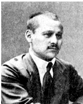
ХАРИС ЙОМАҒОЛОВ 1891–1937

Харис Йомағол улы Йомағолов – Башкорт милли-азатлык хәрәкәте етәкселәренең береһе, дәүләт эшмәкәре. 1891 йылдың 3 ғинуарында һамар губернаһы Пугачев өйәҙенең (хәҙерге һамар өлкәһенең Оло Чернигов районы) Хәсән ауылында тыуған.