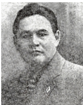
ТАҢИР ИМАКОВ 1895 – 1937

Таһир Ғилман улы Имаков – Башҡорт милли-азатлыҡ хәрәкәтендә әүзем катнашкан эшмәкәрҙәрҙең береһе, Зәки Вәлидизең яҡын көрәштәше. 1895 йылдың 26 октябрҙә Ырымбур губернаһы Ырымбур өйәҙенең (хәҙерге Башҡортостан Республикаһының Көйөргәҙе районы) Кансыра ауылында тыуған.