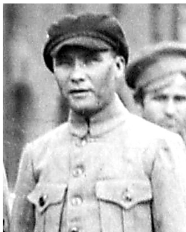
ИБРАҺИМ ИСХАКОВ 1891 – 1921

Ибраһим Ейәнбай улы Исхаков – Башкорт милли-азатлыҡ хәрәкәтендә әүзем катнашкан башкорт офицерзарының береһе, Әхмәтзәки Вәлидизең яҡын көрәштәше. 1891 йылда Өфө губернаһы Стәрлетамак өйәзе (хәзерге Башкортостан Республикаһының Стәрлетамак районы) Мырзаш ауылында тыуған. 1913 йылда батша армияһына хезмәткә алынып (хәрби мәктәп тамамлаған күрәһең), офицер дәрәжәһендә кайтып төшә.