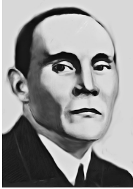
ҒӘЗИЗ ӘЛМӨХӘМӘТОВ 1895 – 1938

Ғәзиз Әлмөхәмәтовты без башкорттоң мәшһүр йырсыһы, профессиональ башкорт музыка сәнғәтенә нигеҙ һалыусыларҙың береһе тип беләбез. Архив документтары уның Башкорт милли-азатлыҡ хәрәкәтендә әүзем катнашкан эшмәкәрҙәрҙең береһе булғанлығы тураһында ла һөйләй.