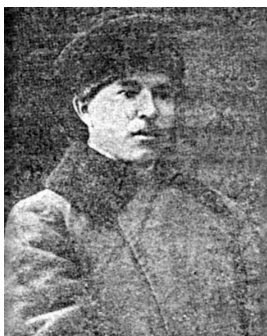
ИЛДАРХАН МУТИН 1888 – 1938

Илдархан Ибраһим улы Мутин – Башкорт милли-азатлык хәрәкәте етәкселәренең береһе. Сығышы менән төньяк-көнбайыш башкорттарынан. 1888 йылдың 21 июлендә Өфө губернаһының Минзәлә өйәзенә караған Үрге Такталасык ауылында тыуған. Бөгөн был ауыл Татарстандың Актаныш районына карай. Әйткәндәй, революцияға тиклем 150 мең башкорт йәшәгән Минзәлә өйәзе 1920 йылда яңы төзөлгән Татар АССР-ына бирелә.