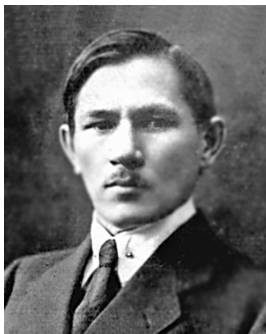
ХАФИЗ КУШАЕВ 1888 – 1938

Хафиз Кушай улы Кушаев – Башкорт милли-азатлык хәрәкәте етәкселәренең береһе, күренекле дәүләт эшмәкәре. 1888 йылдың 15 октябрҙә Ырымбур губернаһы Силәбе өйәҙенең (1918–1934 йылдарҙа Башкортостандың Арғаяш кантоны, хәҙер Силәбе өлкәһенең Арғаяш районы) Күзәш ауылында тыуған.