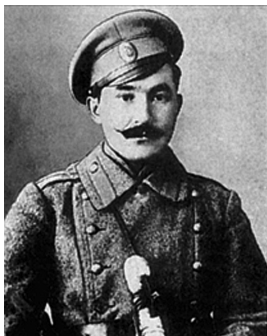
ҒӘЛИМЙӘН ТАҒАН 1892 – 1949

Ғәлимйән Ғирфан улы Таған – Башкорт милли-азатлык хәрәктендә әүзем катнашкан башкорт офицерзарының береһе, Зәки Вәлидиҙең яҡын көрәштәше һәм дуһы, каһарман сардар. 1892 йылдың 1 ғинуарында Ырымбур губернаһы Силәбе өйәҙе Катай улыһының (хәҙер Курған өлкәһенең Әлмән районы) Тәңреғол ауылында тыуған. Ғәлимйән Таған тәүҙә ауыл мәҙрәсәһендә, артабан Рус-башкорт мәктәбендә уҡый. Һуңынан Уҡытыусылар семинарияһын тамамлай һәм урыс буламаған мәктәптәрҙә урыс телен уҡыуһы һисемен алып, уҡытып йөрөй.