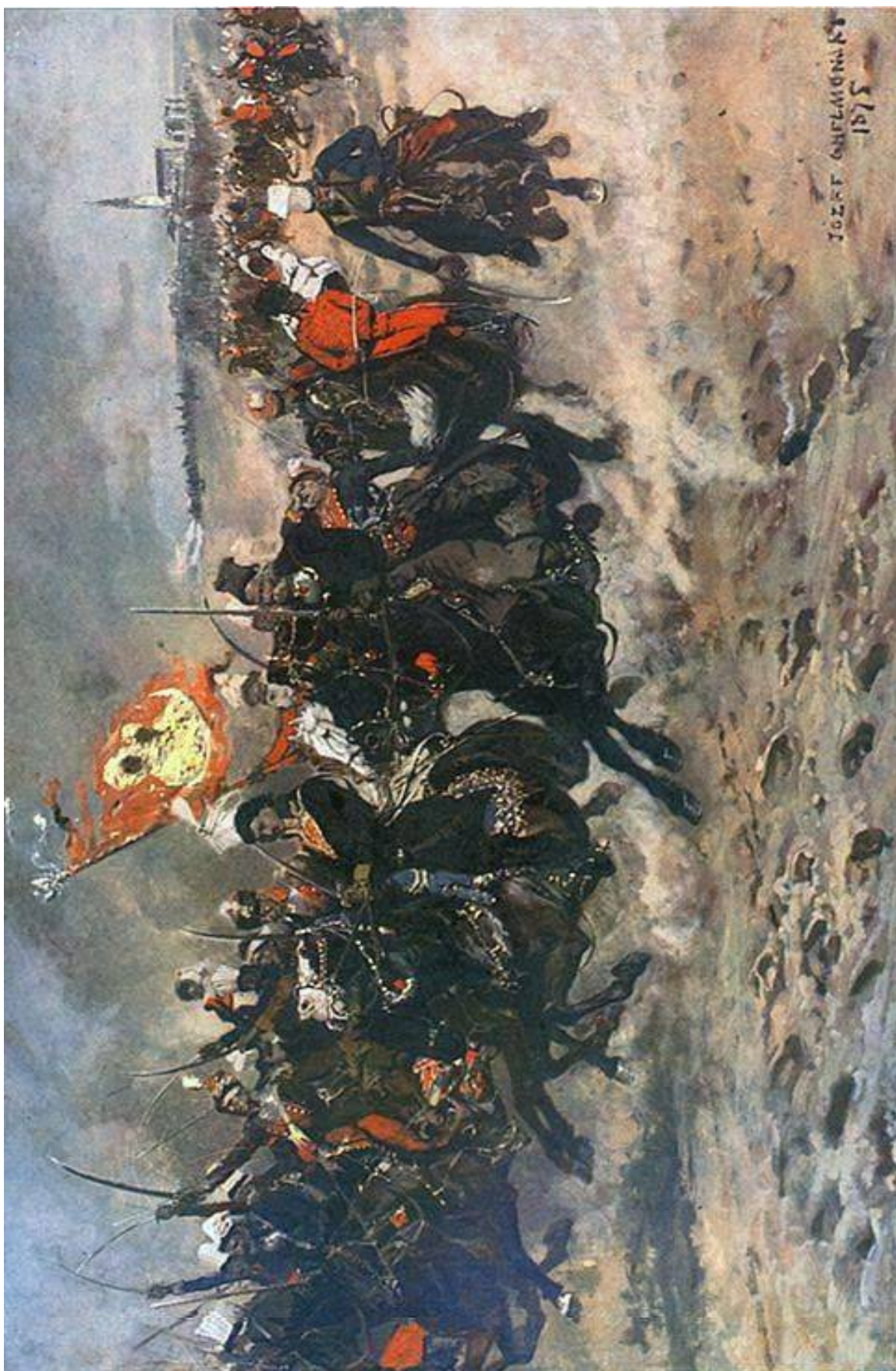
Сражение под крепостью Ченстохово, последнего оплота конфедератов, 7 августа 1772 г. С картины Юзефа Хелмоньского «Казимеж Пулавский под Ченстоховой» (1875).