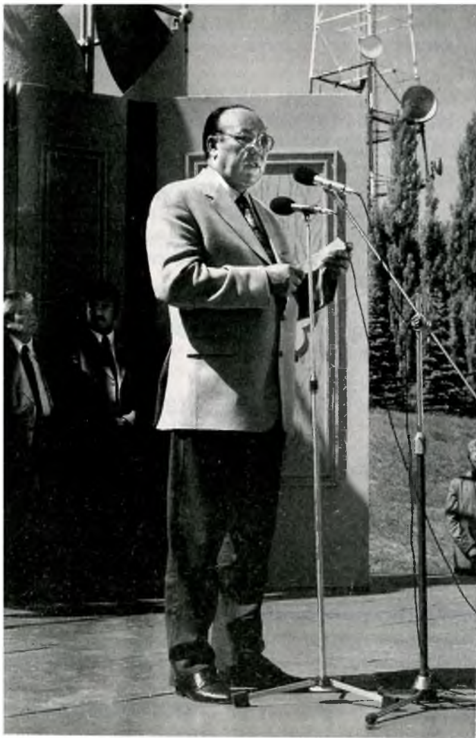
Башкортостан Республикаһы Президенты Муртаза Рәхимов. Арткы планда: Премьер-министр урынбағары Хәлф Ишморатов һәм халыҡ язуһыһы Мостай Кәрим.