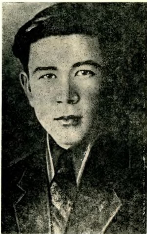
Герой Советского Союза ЗУБАЙ УТЯГУЛОВ