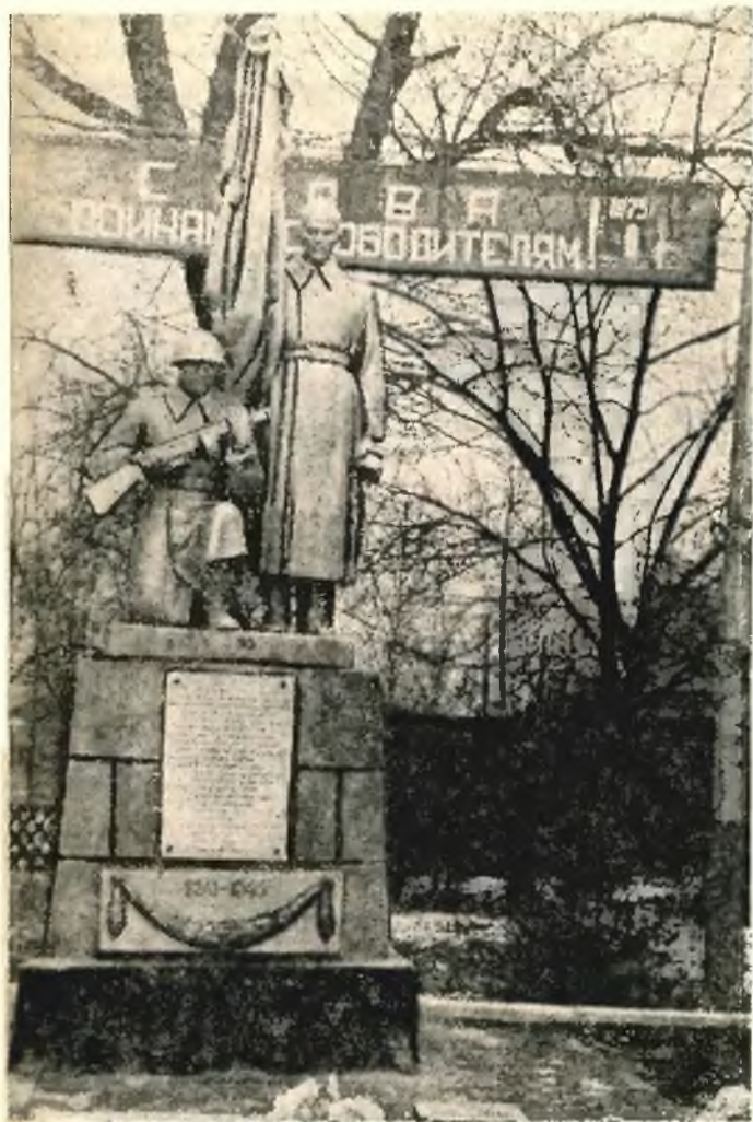
Памятник 13 воинам-героям на станции Красновка Ростовской области.