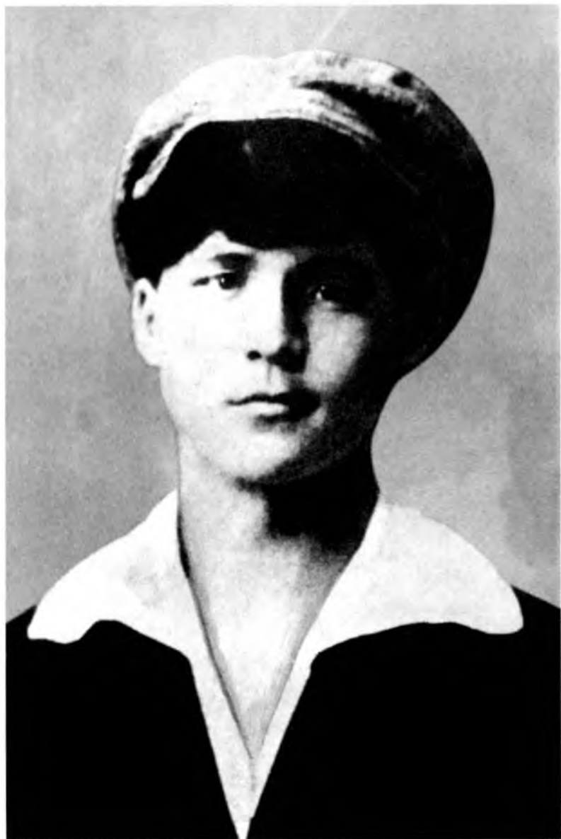
Казахский поэт и артист Динше, представлявший Алаш Орду в Бухаре и Самарканде.