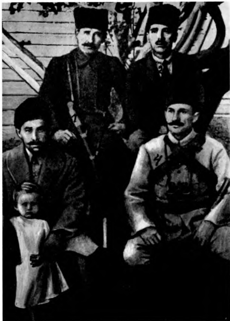
Турецкие офицеры, входившие в свиту Энвера паши: 1) Али Риза, 2) Бартинли Мухитдин, 3) полковник Хасан, 4) полковник Халил.