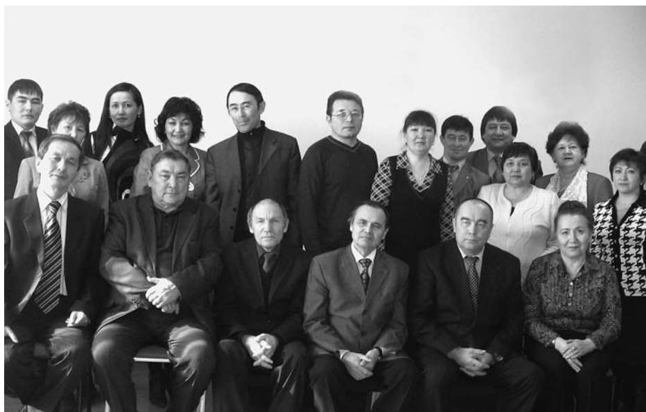
Семинарға иштәлеккә төшөлгән фото, 2010 йылдың 25 февралә.

(ғөмүмән, филми-тарихи нигезлә легенда-фараз) Булат Рафиковтан һуң бер ни кәзәр етемһерәп тә калғайны. Н. Алсынбаевтың был эстафетаны дауам итеүе һөйөндөрә.