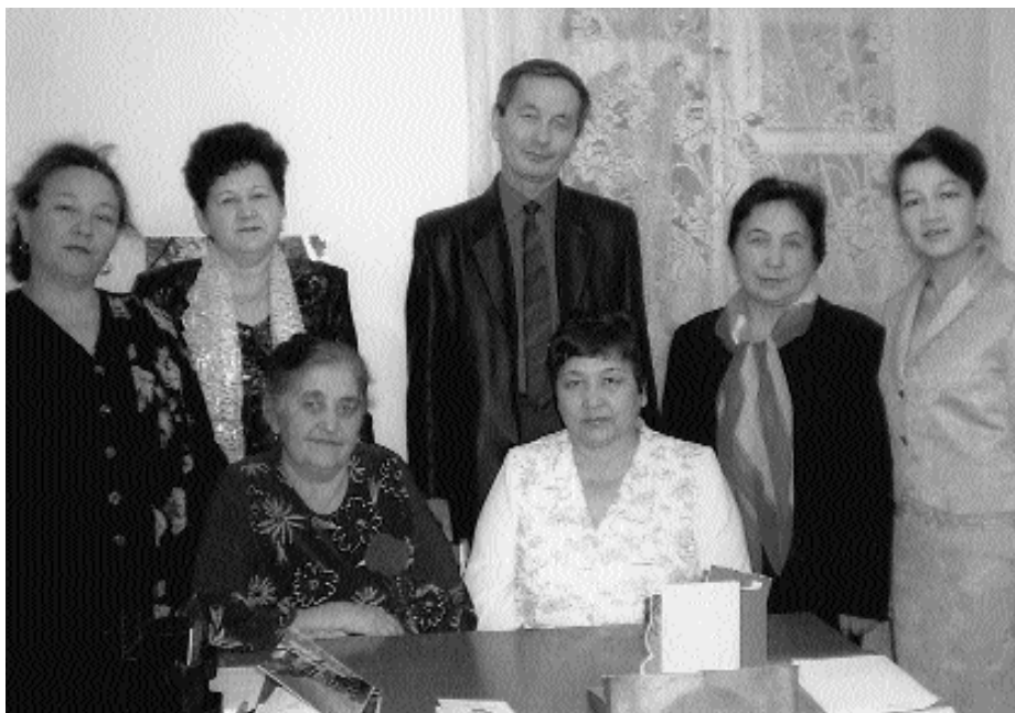
Сибай языгуыларынан бер төркәм.

Сибай төбәк языгуылар ойошма ының асылуына 15 йыл. Ошо арауыкта ул башлап языгуыларзың, кәләм тирбәтеүселәрзең килеп йөрөгән йылы әм якты йортона әүерелде. Бөгөн уның сафында 40-тан ашыгу башлап языгуы әм 8 РФ әм БР Языгуылар союздары ағ-