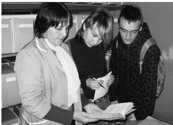
Фонд йәштәрзә айырыуса кызык ыныу тыузыра.

тип тарткылай, Белмәйем, Әллә алла, әллә иблис алдалай?!