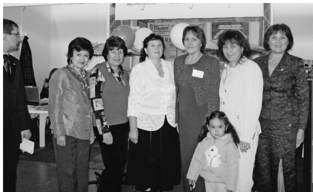
Башкортостан Китап палата ы хезмәткәрзәре.

Рәсәйзе тетрәткән кишкен боролоштар осоронда – 1917 йылдың 27 апрелендә (хәзергесә 10 майында) Эске эштәр министрлығына караған Матбуғат буйынса баш идаралыкты бөтөрөү буйынса Вақытлы хөкүмәттең карары кабул ителә. Карарзың 3-сө бүлегендә Китап палата ы булдырыу тура ында үз бара. Уға Рәсәйзе рус телендә сыккан барлык матбуғат басмаларын фәнни рәүештә өзлөк өз теркәү эше йөкмәтелә. Дәүләт учреждениеларын, шулай ук дәүләт китап аклағыстарын илдә донъя күргән басма әсәрзәр менән тәьмин итеү бурысы ла Палатаның елкә енә төшә. Рәсәй