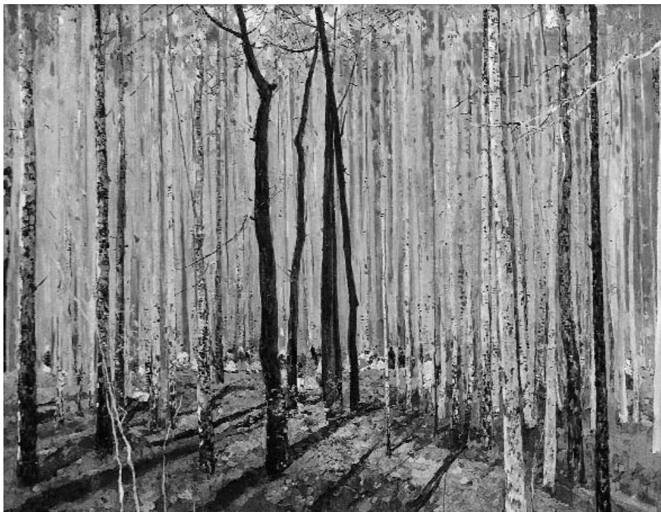
“Май. Кайынлык”. 1960.

мәктәпкә эшкә ебәрелә. Әммә укытыусы рәссамлык хыялын ташламай. Көн һайын пленэрға сыға. Теләһә ниндәй һауа шарттарында, теләһә ниндәй яктылыкта ла живопись тигән катмарлы жанрҙың серҙәрәнә төшөнөргә тырыша.