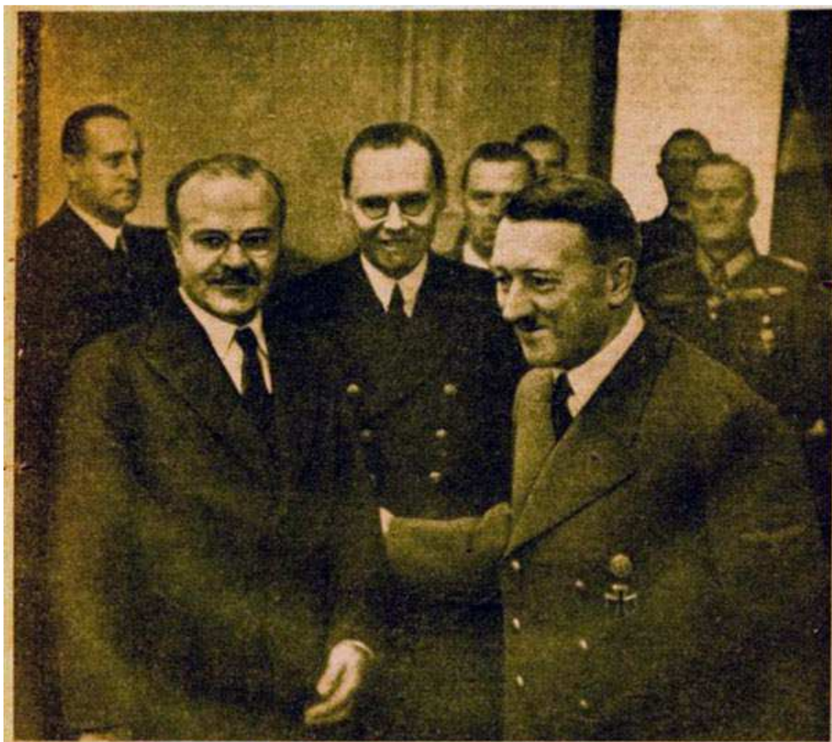
Пробывание Председателя Совариома СССР и Народного Комиссара Иностраных Дел тов. В. М. Молотова в Берлине. На снимке — т. В. М. Молотов и т. А. Гитлер в ловой имперской канцеларии.