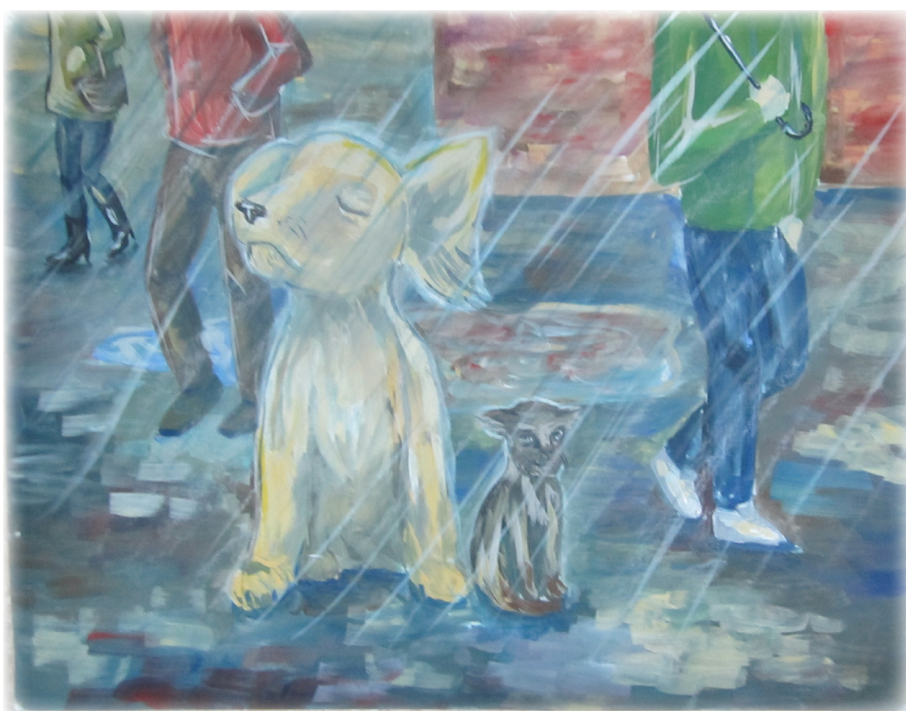
Рисунок Галицуллиной Регины, 10Б класса