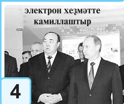
электрон хезмәттә камиллаштыр