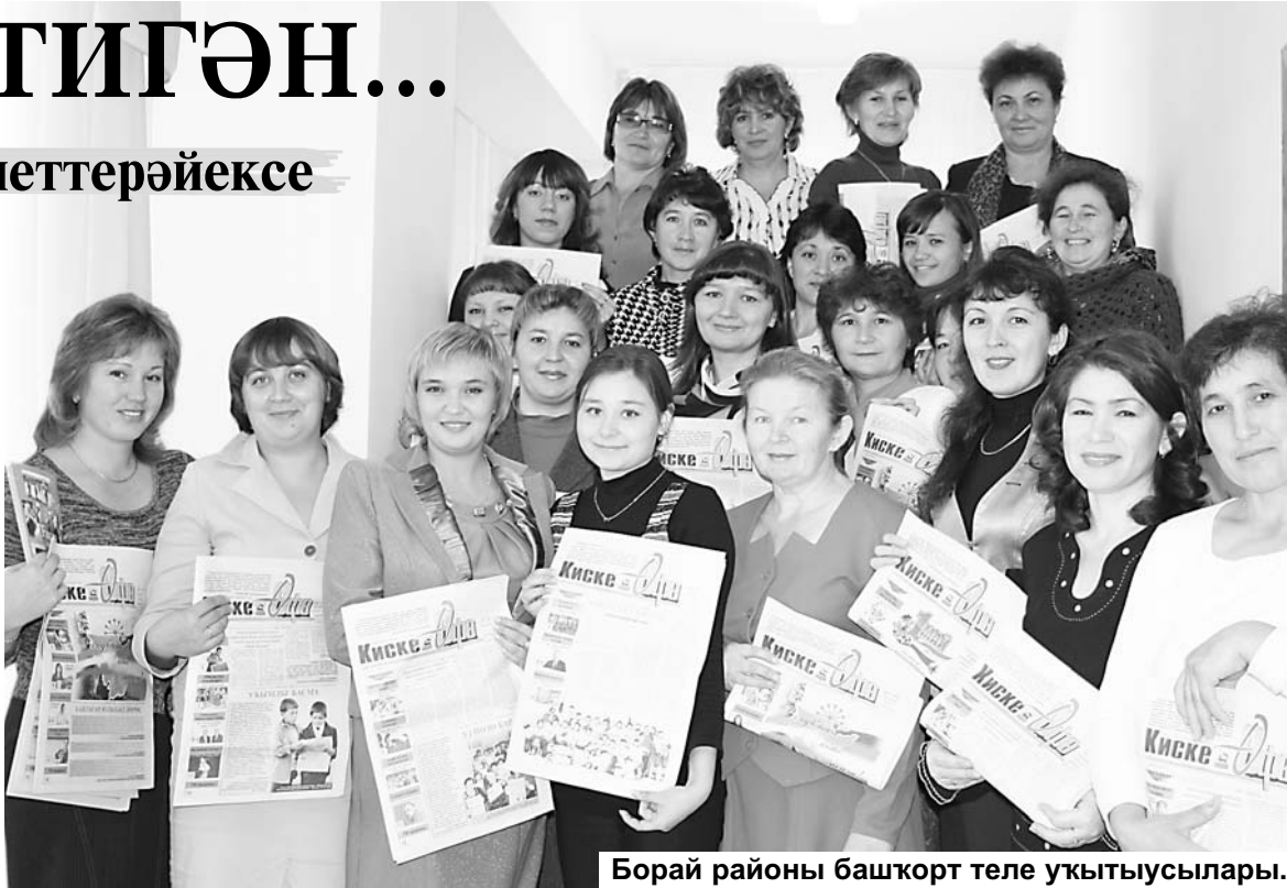
Борай районы башкорт теле укытыусылары.

• Азнаһына бер тапкыр редакциянан килеп алып йөрөй алһағыҙ, гәзит-безгә редакцияның үзәндә язылыу за уңайлы һәм арзанырак: ярты йылға - 225 һум.