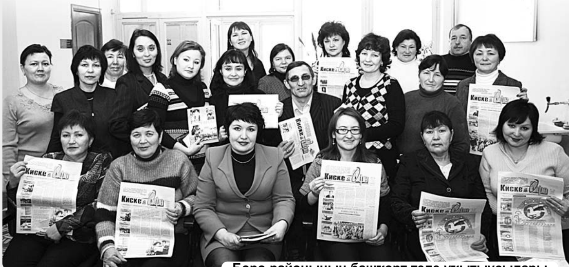
Берә районының башқорт теле уқытыусылары.

2011 йылдың икенсе ярты йыллығына гәзитәбезгә язылыу бара. Май айында гәзитәбезгә язылыу тураһындағы қвитанцияларын редакцияға ебәрәүселәргә башқорт телендәге 5 "Көрһән - Кәрим" китабы вәғәзә итәбез.